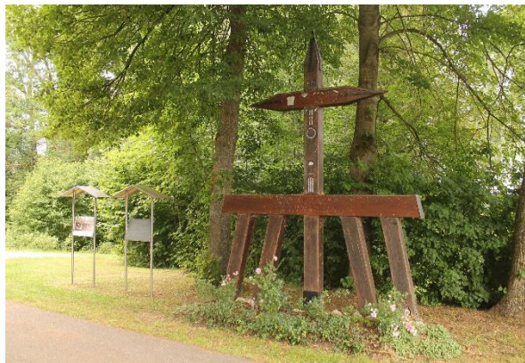
Bei diesem Denkmal handelt es sich um ein ehemaliges .....