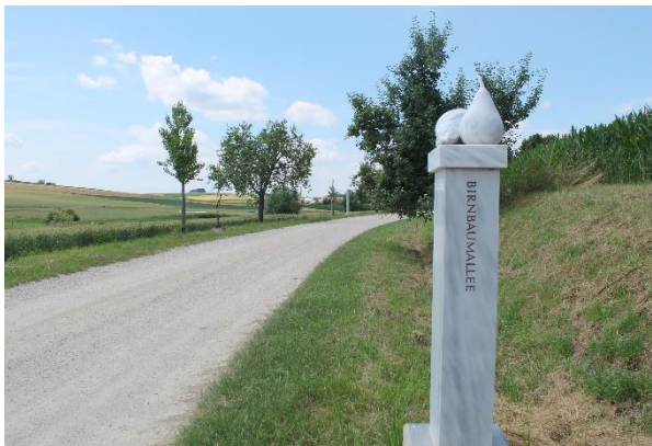
Die Birnbaumalle wurde im Jahr ..... errichtet.