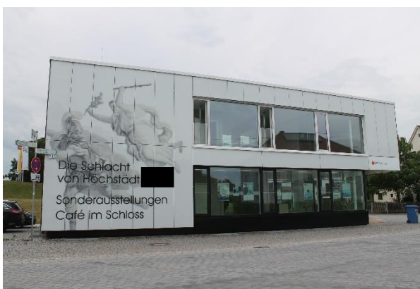
Die Schlacht von Höchstädt fand ..... statt.