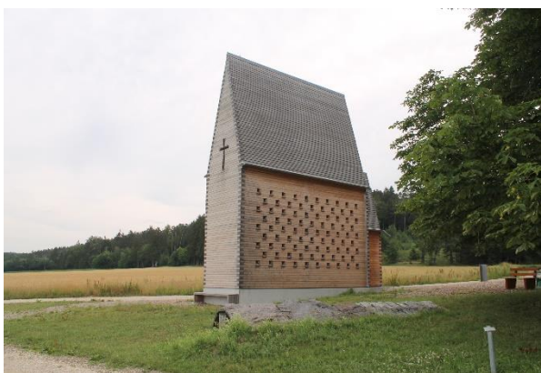
Diese Kapelle wurde vom Architekten ..... erbaut.