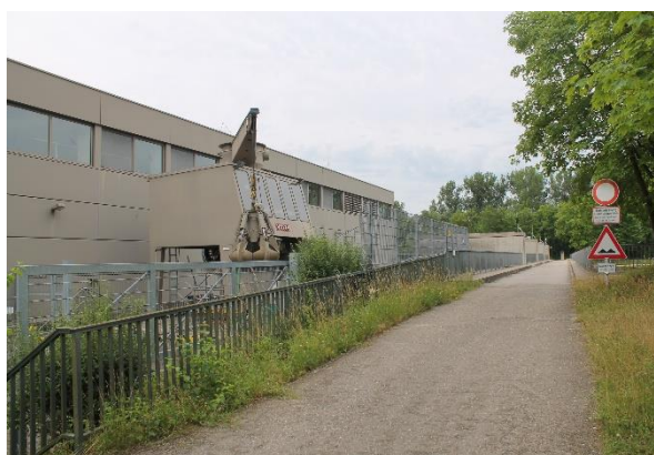
Dieses Donau-Kraftwerk erzeugt jährlich rund ..... kWh Strom.