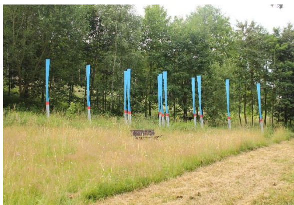
Bitte Lächeln! 😊 Der Fotopunkt an der Donautal-L Route.